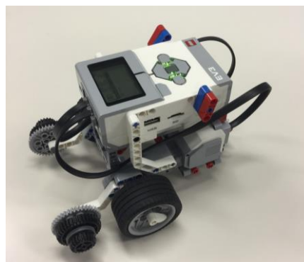
<教育版レゴ® マインドストーム® EV3>

iii) 内容 教育版レゴ® マインドストーム® EV3を用いて、モーターや各種センサーを使ってロボットを組み立て、ビジュアルアイコンを使ったソフトウェアでプログラミングを行います。