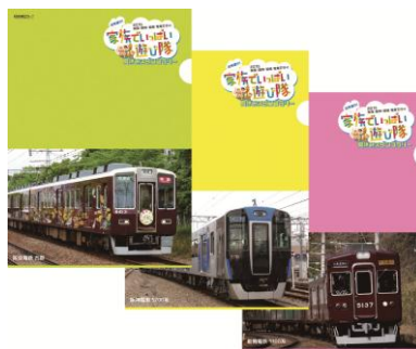
※参加賞：クリアファイル（阪急×3種類、阪神・能勢×各1種類）