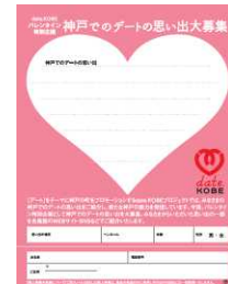
大好きな人と手をつなぐための手袋「GLOVERS」 共通のデートログ募集用紙