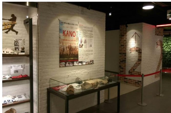
「KANO~1931 海の向こうの甲子園~」 歴史館内展示品