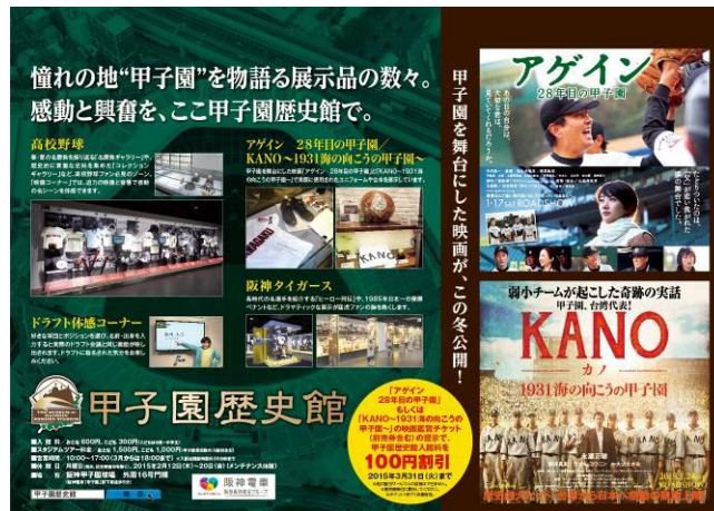
阪神電車 中吊り広告掲出デザイン