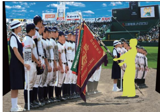
【トリックアート イメージ図（人有り）】

90周年記念事業は2014年を通して実施し、今後も様々な企画を打ち出していく予定です。