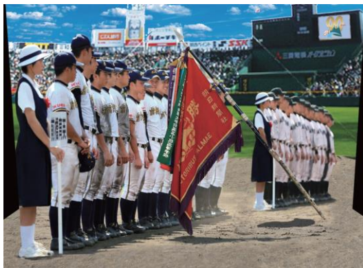
【トリックアート イメージ図】