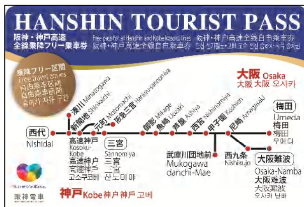
「HANSHIN TOURIST PASS」券面デザイン

阪急阪神ホールディングスグループで取り組む、インバウンド施策の一環として、より多くの訪日外国人のお客様に阪急・阪神の沿線にお越しいただけるよう、「HANKYU TOURIST PASS」に加えて、「HANSHIN TOURIST PASS」の発売を開始します。