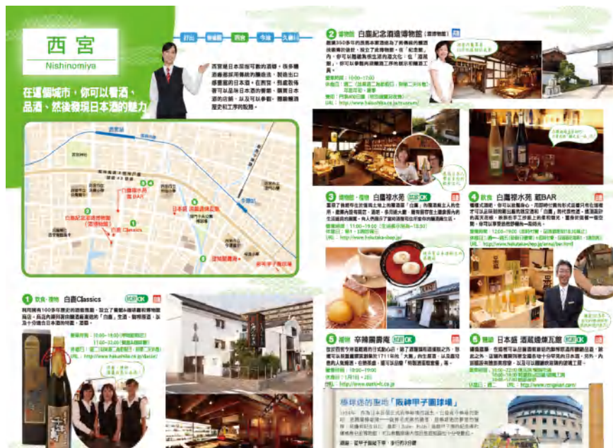
(中間：西宮駅ページ・繁体字版)