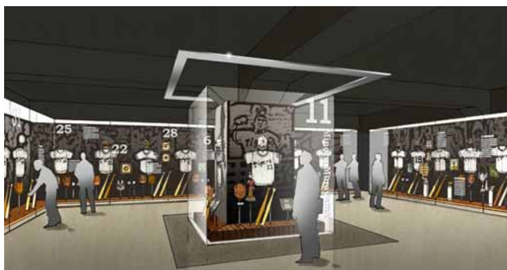
< 「阪神タイガースの歴史」コーナーのイメージ >