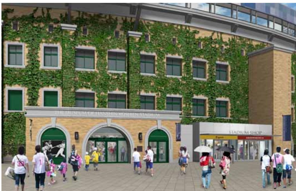
<甲子園歴史館（仮称）正面イメージ>