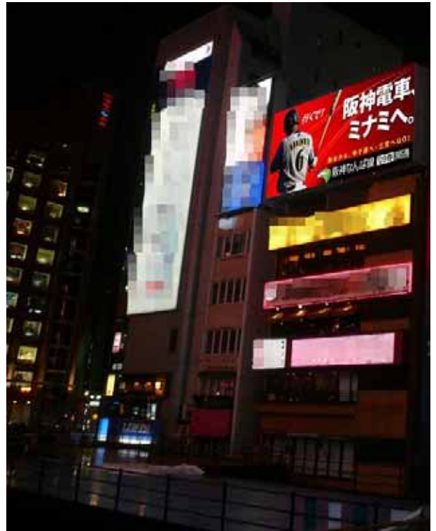
戎橋から見たイメージ