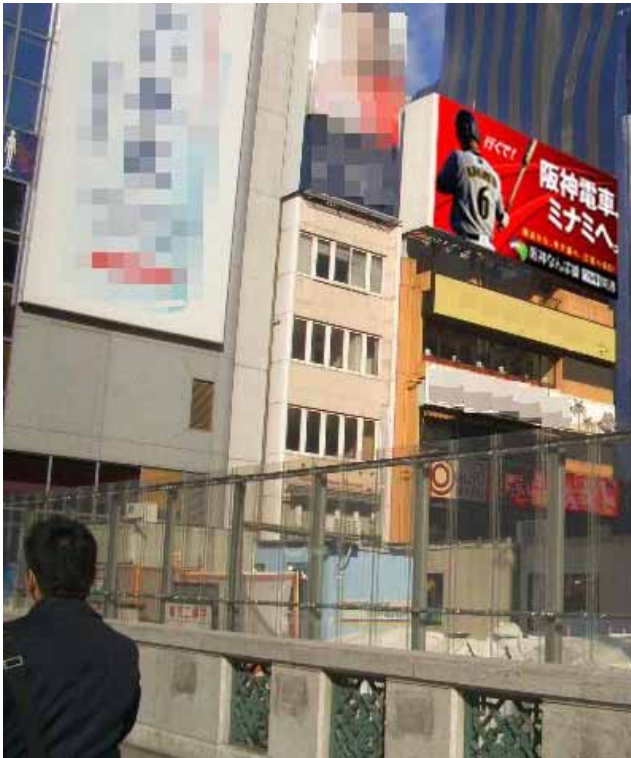
道頓堀橋から見たイメージ