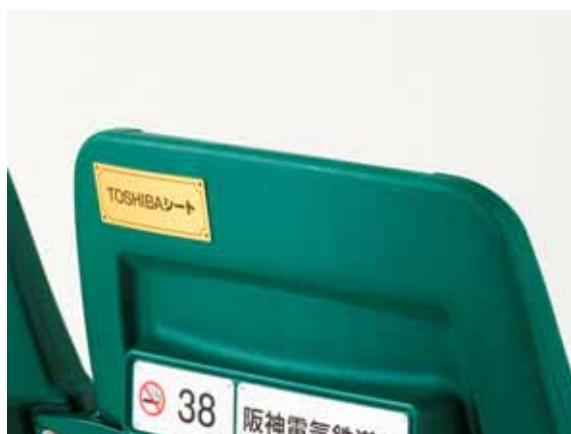
TOSHIBAシートのイメージ