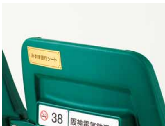
みずほ銀行シートのイメージ