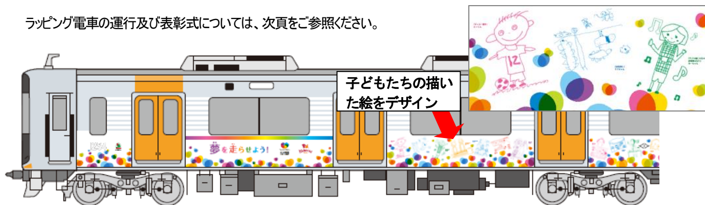
【ラッピング電車 デザイン】